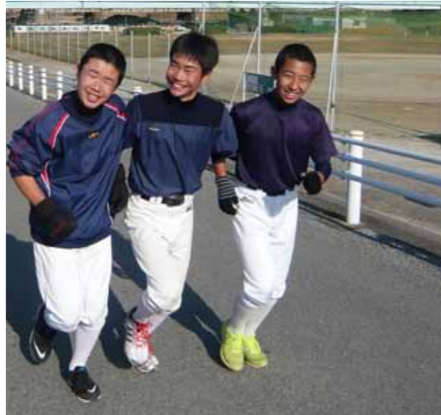
楽しそうですが、非常に遅いです ^^