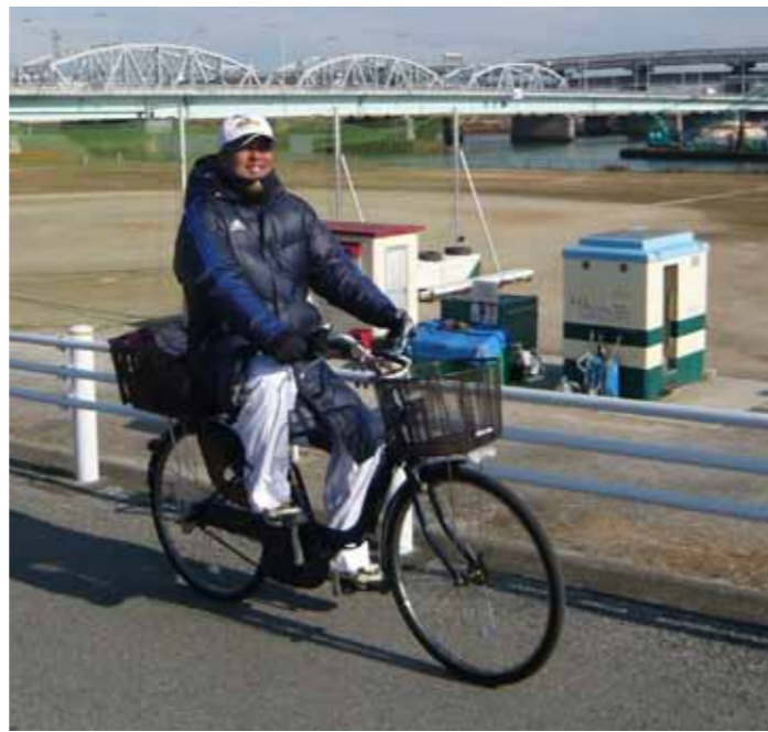
電動チャリずるいんですけど！