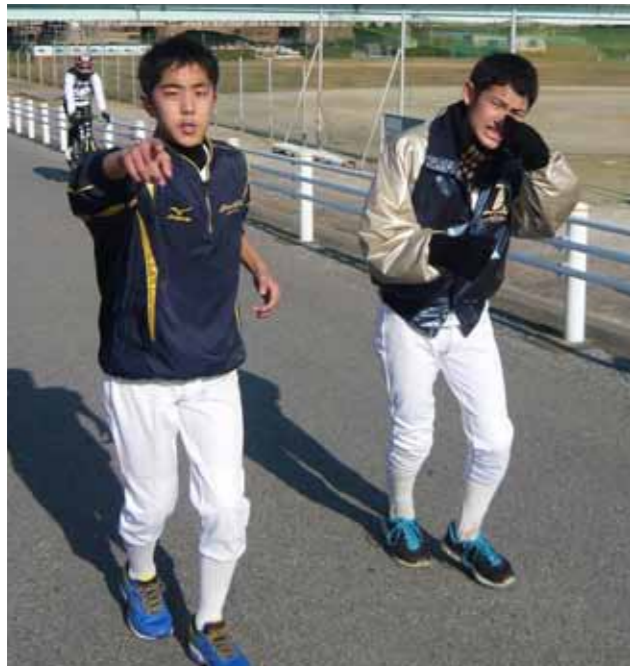
何撮ってんだよ！ 泣いて良いですか？