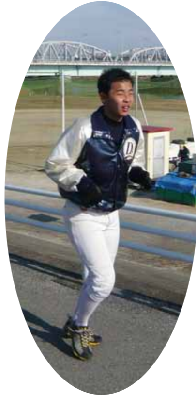
高校でもがんばれ