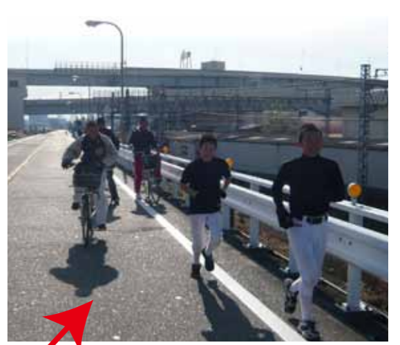
先頭集団（頑張り軍団）